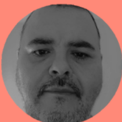
MANUEL REYES GITARRISTA