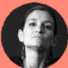
EVA MORENO BAILARINA Y COREÓGRAFA